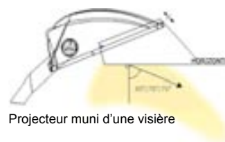
Projecteur muni d'une visière

L'utilisation des projecteurs n'est pas permise si inclinés à plus de 15 degrés au-dessus de l'horizon ou, si l'inclinaison est supérieure à cet angle, les projecteurs doivent posséder des visières internes ou externes de manière à respecter la proportion de lumière émise au-dessus de l'horizon, tel qu'indiqué au point 4.3.1.